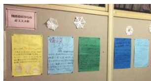
【図書委員会新聞の掲示】