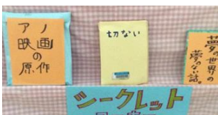
【シークレットコーナー】

本校の図書委員会では、図書室の環境整備や、おすすめ本の紹介を中心に行っている。環境整備では、読みたい本がすぐに探せるよう、書架表示板を作成した。本の紹介では、図書委員会新聞の発行、ポスターの廊下掲示、POPの作成と展示を行った。カウンター前では、来訪者の目を引くよう、「シークレットコーナー」を設置し、普段読まないジャンルの本との出会いを提供するなど、読書活動の推進を図っている。