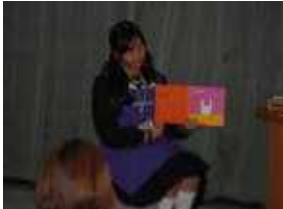
場体験における生徒による読み聞かせ体験活動