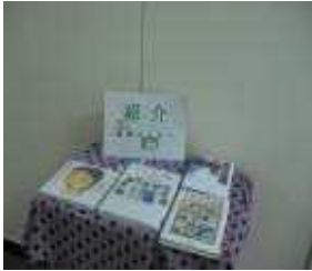
放送室前 図書紹介コーナー

1年生の職場体験学習(11月26日から30日実施)において、妻沼図書館に4名(男子2女子2)が参加し、読み聞かせ等の活動を体験した。