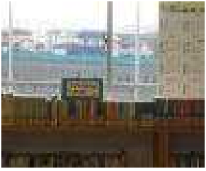
(図書室 こころのたからコーナー)

利用者が利用しやすいよう分類番号順整理されている。また、「新着本」・「こころのたから」・「青山七恵」(本校卒業生)コーナーを設置している。