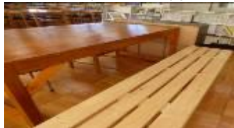
図3 技術部作成の机やベンチ