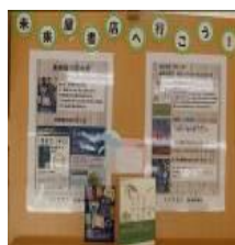
図4 図書委員会作成POP

職場体験で書店に行く生徒は実習中にPOPを作成する。この活動を体験した生徒は読書への関心が高まったことを踏まえ本活動を継続させ、今年度は「未来の“本好き”を育てよう」をテーマとし、書店と本校で