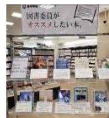
図5 地域の書店との連携による環境づくり