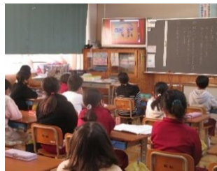
今年度の動画読み聞かせ