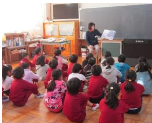
例年の読み聞かせ

例年、ボランティアや児童、先生方の読み聞かせを行っているが、今年度は図書委員会児童による動画の読み聞かせに変更した。