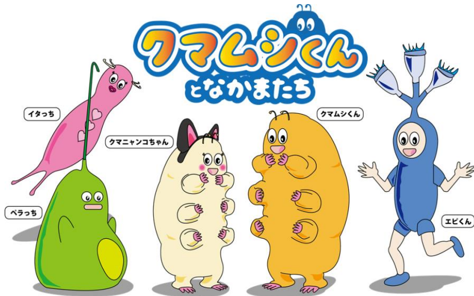
埼玉の下水道マスコット

「クマムシくんとなかまたち」は、汚れた水をきれいにする微生物をキャラクター化したものです。