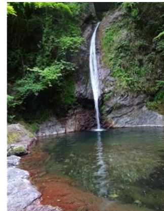
赤いチャートからなる秩父華厳の滝

秩父華厳の滝のように見た目が特徴的な滝や、今宮神社の龍神池など秩父市内で見られる段丘伏流水のほか、札所 34 番水潜寺の長命水のように健康祈願などの信仰の対象になっている湧き水や滝も紹介します。