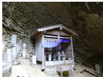
札所32番法性寺の観音堂裏手にある岩崖(タフォニ)

神社仏閣で見られる地形を、河岸段丘など川が造った地形、タフォニなど海が造った地形、断層や褶曲などその他の地形にわけて紹介します。