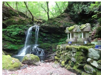
三峯神社 清浄の滝