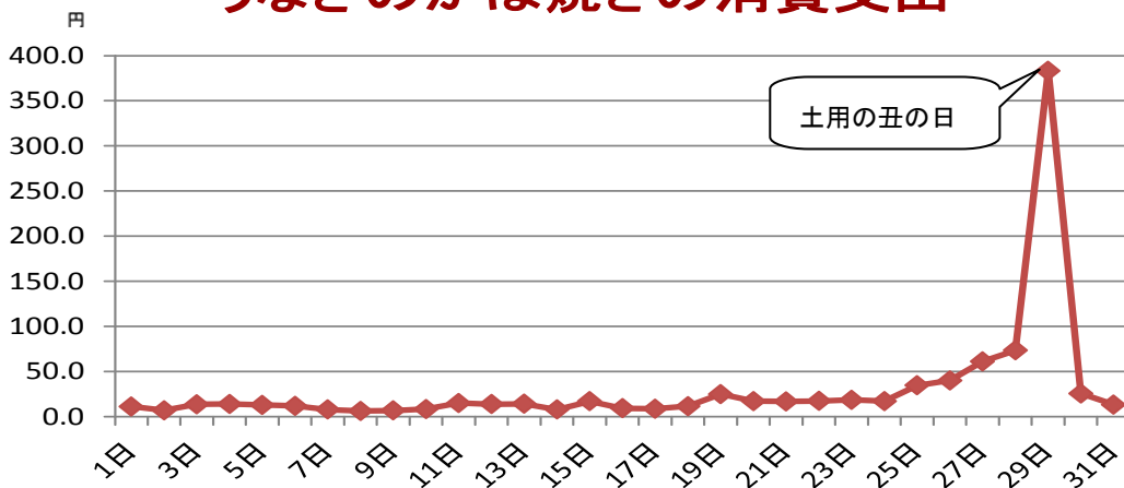
うなぎのかば焼きの消費支出

このように、家計調査の結果から地域や暮らしの特性や変化が見られ、行政や企業等にとって重要な参考資料となっています。