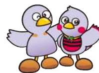
埼玉県マスコット 「コバトン」 & 「さいたまっち」