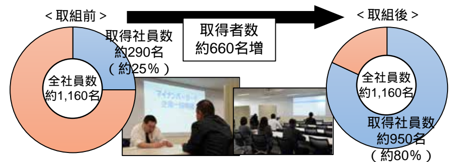
C社のマイナンバーカード取得状況