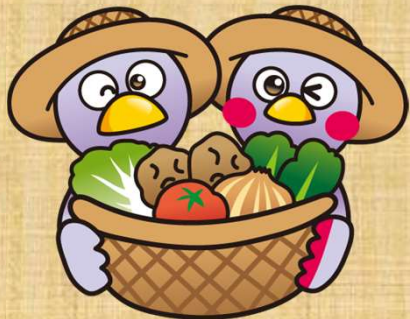
埼玉県マスコット「コバトン」、「さいたまっち」

【問合せ】 埼玉県農林部農産物安全課 総務・食品品質表示担当 電話：048-830-4110 FAX：048-830-4832 E-Mail：a4070-08@pref.saitama.lg.jp