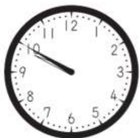
家を出発した時刻