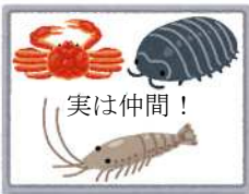
写真③(ひみつ 3) ダンゴムシは、 エビやカニの仲間

(1) 発表原こうには、どのような工夫がありますか。1〜4の中から最もふさわしいものを一つ選んで、その番号を書きましょう。