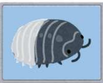
写真①(ひみつ 1) 見つけたダンゴムシ (だっぴの仕方)