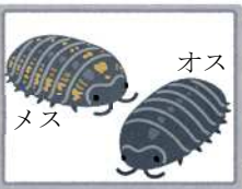
写真②(ひみつ 2) オスとメスの ちがい