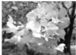
▲サクラ （ソメイヨシノ）