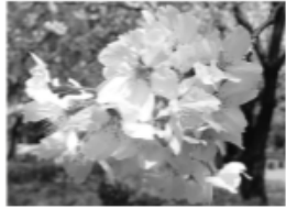
▲サクラ （ソメイヨシノ）