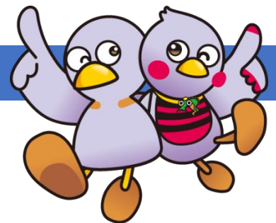
埼玉県のマスコット コバトン&さいたまっちゃん

研修案内ホームページURL https://www.pref.saitama.lg.jp/rihasen/annai/kenshu/souron-online.html