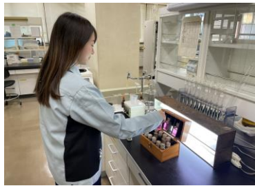
浄水場での水質検査の様子