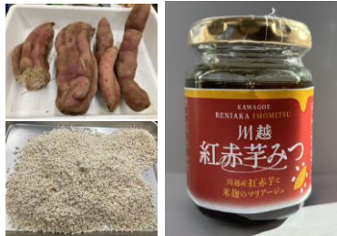
規格外さつまいもと規格外米麴(左)から製造・商品化した「川越紅赤芋みつ」(右)