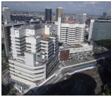
大規模施設の新築工事も行っています。写真は埼玉県立小児医療センターです。

県有施設（県営住宅含む）の新築・改修工事について設計及び施工監理を行います。近年では、新しい施設の整備から既存施設の利用形態を見直し、機能向上のための増改築・改修、耐震補強など施設の有効活用や経年劣化に対応した改修を行っています。