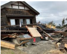
地震による被害を最小限に抑えるため耐震改修の補助や出前講座等の啓発事業を行っています。

建築基準法等に基づく建築確認、許認可、検査、パトロール、違反指導等を通して、建築物の安全安心の確保に取り組んでいます。また、大規模な地震の発生が予測される中で、災害に備えた耐震化の促進にも力を入れています。