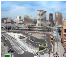
人口減少、超少子高齢社会において、誰もが安心して暮らせるまちづくりの実現に向け、時代に合わせた都市計画の見直しをしています。

県民が豊かな生活を営むことができるよう社会情勢に応じた都市計画に取り組んでいます。また、市街地再開発事業や街並み景観に関する仕事など、魅力的なまちづくりに取り組んでいます。