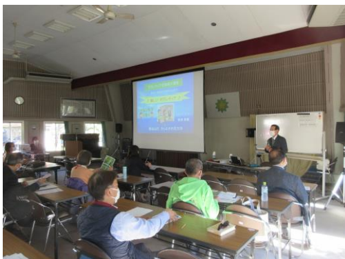
講演：きらめき市民大学講堂