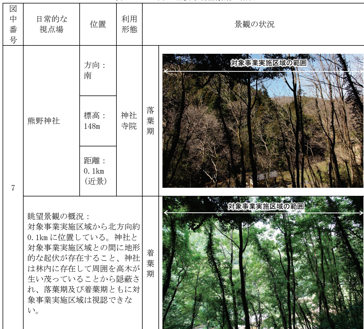
表 8-1-7-6(6) 主要な眺望景観の概況