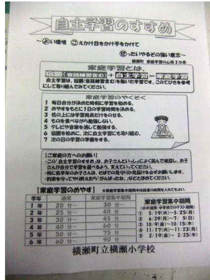
【「自学のすすめ」の配布】