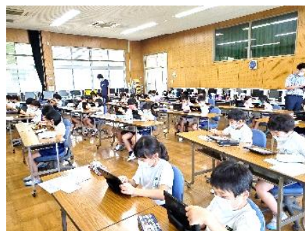
【低学年児童対象授業】