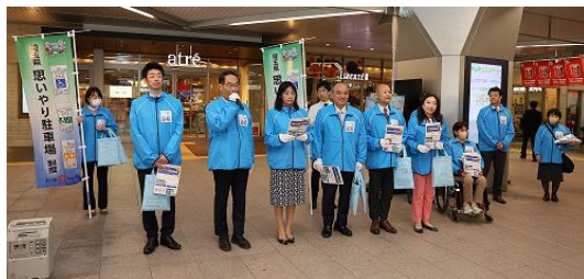
▲駅でのキャンペーンの様子