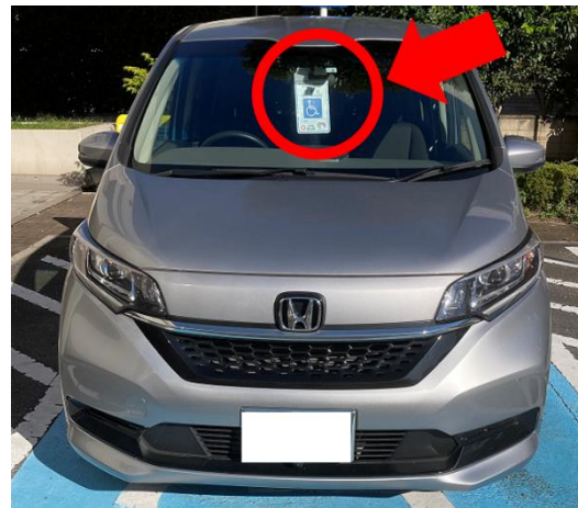
▲使用イメージ（ルームミラーにかける）