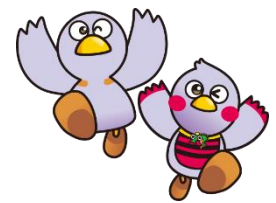
コバトン&さいたまっちゃん