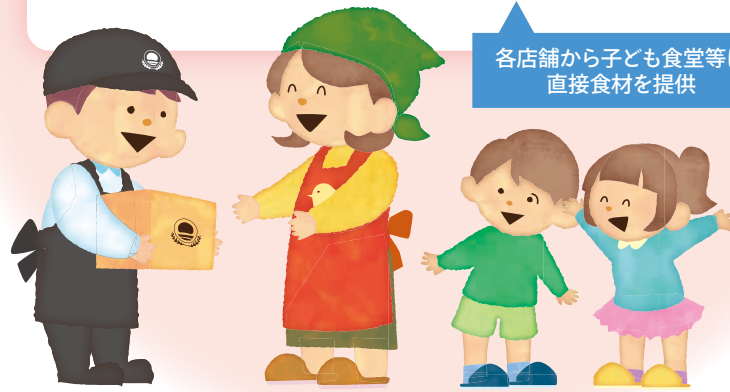
各店舗から子ども食堂等に直接食材を提供