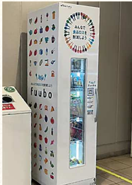
ハレノテラス(さいたま市)