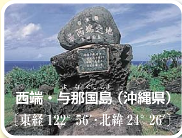
(与那国町ホームページ)