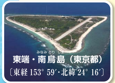
(小笠原村ホームページ)