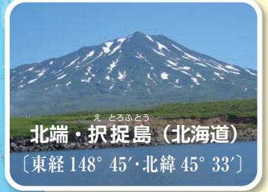
(内閣府ホームページ)