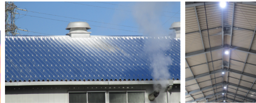
《遮熱シート取付（工場屋根）》