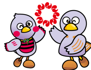
埼玉県のマスコットコバトン・さいたまっち

このご案内は、令和8年3月現在の内容です。 今後、変更になる場合がありますので、最新情報は、お住まいを管轄する保健所や県のホームページでご確認ください。