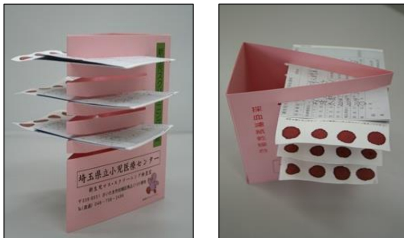
図3 ろ紙の乾燥方法

* 3 水平を保たず乾燥させると血液が偏った状態で凝固するため、正確な検査ができない。