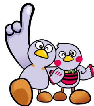
埼玉県のマスコット「コバトン」・「さいたまっち」

埼玉 就学支援金 国公立 検索 埼玉県教育局教育総務部財務課 授業料・奨学金担当 電話 048-822-5670 FAX 048-833-0497