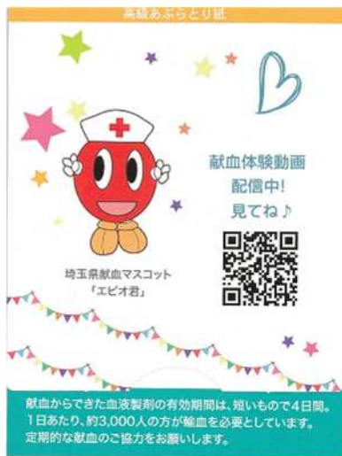
左図：表面 (献血啓発)

キャンペーン期間中は、成人式等で啓発用あぶらとり紙(両面フルカラー)約5万部を配布しました。 ※ 薬物乱用防止啓発事業と共同で作成。