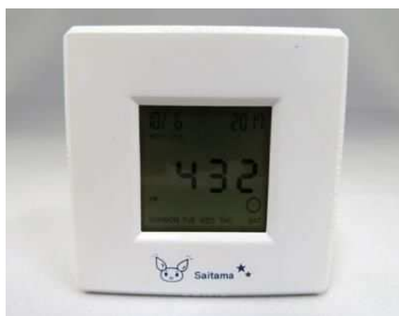
▼ 4ファンクションクロック