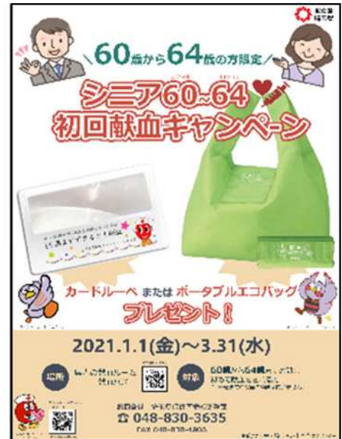
右図：広報ポスター