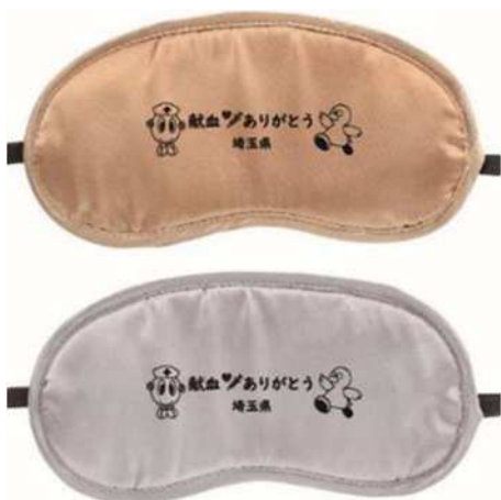
左図：記念品 右図：広報ポスター

期間中、献血に御協力いただいた生徒に記念品(3WAYアイマスク)を贈呈しました。