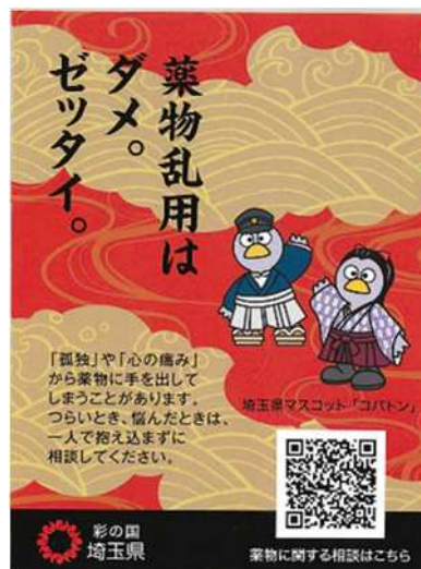
右図：裏面 (薬物乱用防止啓発)