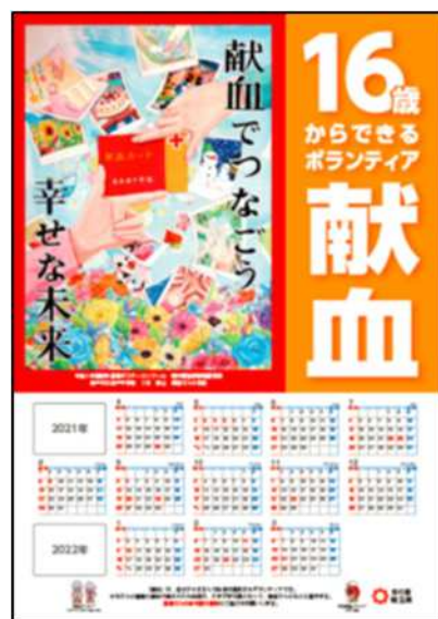
作成したカレンダーポスター

また、34点の優秀作品は、8月13日から8月24日まで県庁3階渡り廊下で展示しました。