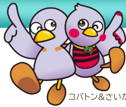
コバトン&さいたまっちょ