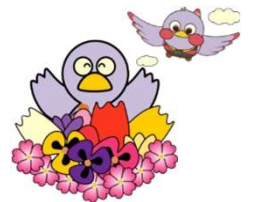
埼玉県マスコット「コバトン」「さいたまっちゃん」

備 考 動画視聴に係る通信料等は、視聴される方の負担となります。 資料は「子供たちとその保護者のための不登校支援サイト」上にあります。 本講演の録画、録音、撮影、および資料の2次利用、詳細内容のSNSへの投稿は、固くお断りいたします。 これらの行為が発覚次第、著作権・肖像権侵害として対処させていただきます。