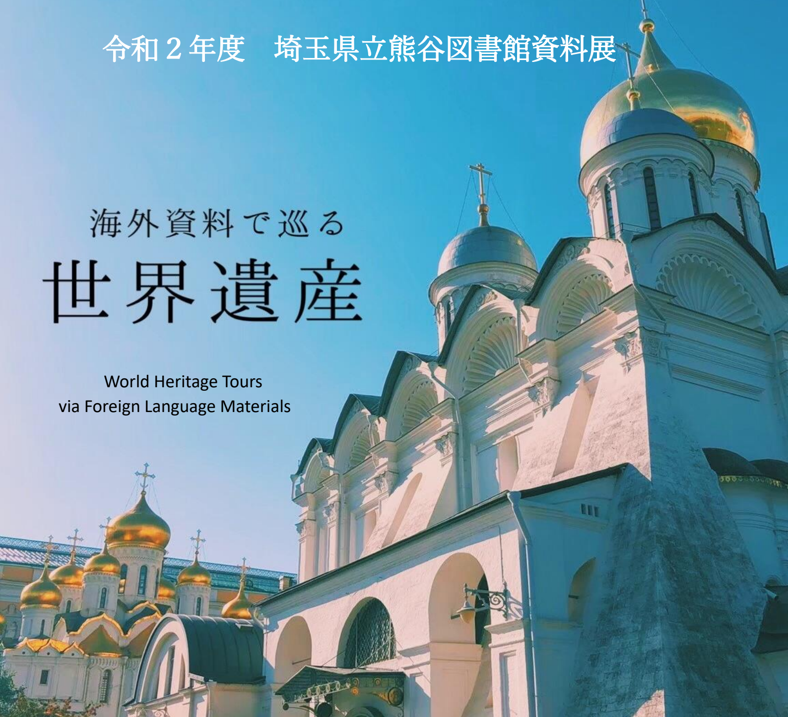
手前：アルハンゲリスキー大聖堂 奥：生神女福音大聖堂（ロシア「モスクワのクレムリンと赤の広場」1990年世界遺産登録）

World Heritage Tours via Foreign Language Materials