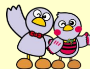
埼玉県のマスコット 「コバトン」「さいたまっち」

※ 交付決定後に就業規則を改正し、上記の取組(就業規則の改正)を実施する場合が対象となります。