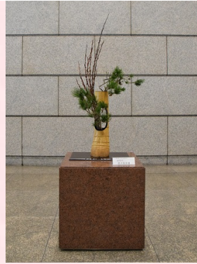
相阿弥流 佐々木幸園 様 ◆花材 根引松、赤芽 柳