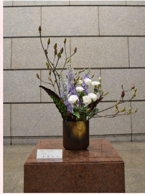
成月流 半井梨芳様 ◆花材 木蓮、カラテ ナ、デルフィ ニューム、トル コキキョウ