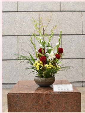
南天、グラジオラス、百合、鶏頭、小菊、フェニックス