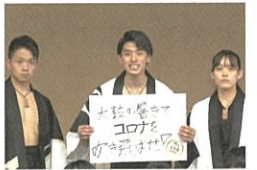
出演者・関係者からのメッセージ