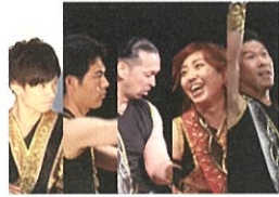
和太鼓演奏 すわんど GOLDEN TIMES