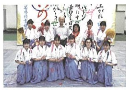
書道パフォーマンス 埼玉県立 滑川総合高等学校 書道部