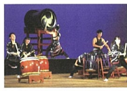
和太鼓演奏 武蔵越生高等学校 和太鼓部