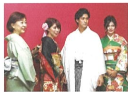
埼玉きもの散歩 NPO法人 川越きもの散歩