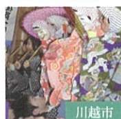
南田島囃子連 足踊り保存会 川越市指定無形民俗文化財