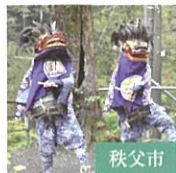
浦山大日堂獅子舞保存会 埼玉県指定無形民俗文化財

うらやま ししまい 浦山の獅子舞 秩父市 ちちぶ やたいばやし 秩父屋台囃子 秩父市 きや まいひ はしごの 木遣り・繰振り・階子乗り さいたま市