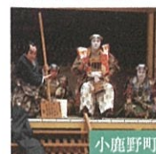
小鹿野町子供歌舞伎・ 小鹿野歌舞伎保存会 埼玉県指定無形民俗文化財