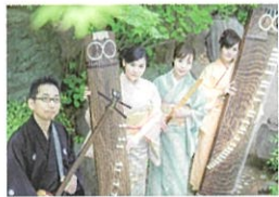
和楽器カルテット サイタマテイツク