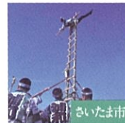
浦和若鷲会・浦和鷲組合 さいたま市指定無形文化財