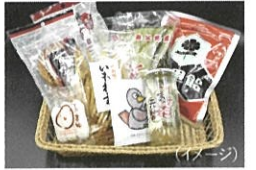
埼玉の食 WABI SABI セット WABI SABI 限定のグルメセットを販売