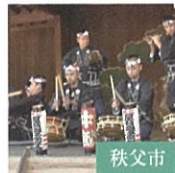
秩父屋台囃子保存会 国指定 重要無形民俗文化財