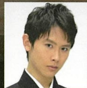
ことめん 箏男 kotomen