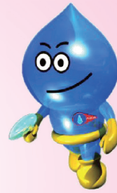
埼玉県営水道のマスコット 「ウォー太郎」