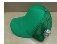
お渡しする帽子につけられます！！