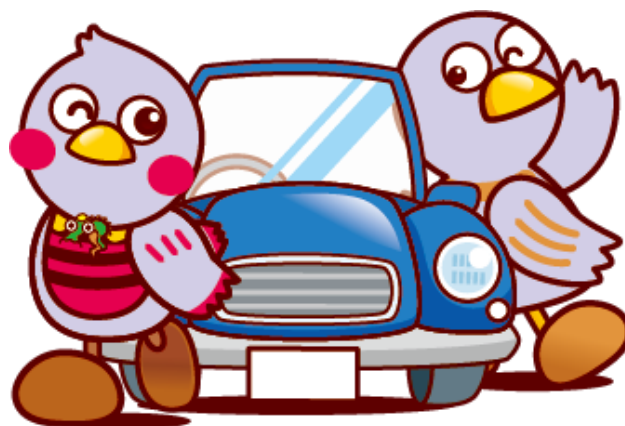
埼玉県マスコット コバトン&さいたまっち