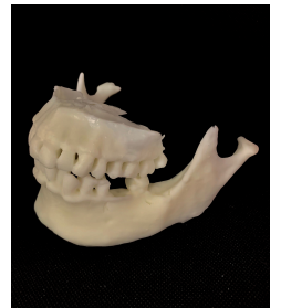
顎骨のデジタル加工