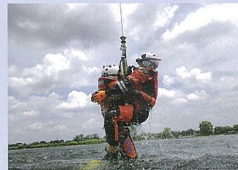
水面からの救助活動