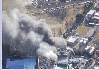
工場火災現場の情報収集