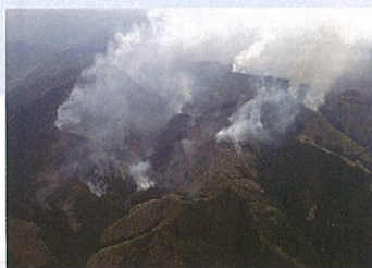
上空から火災状況の偵察

地上からでは火災の状況が把握しにくい林野火災などでは、上空から火災状況の偵察を行い、地上からの消火活動を支援するとともに、地上からの消火だけでは対応しきれない大規模な林野火災や工場火災などに対しては、防災ヘリの胴体下部に消火タンク（ファイアアタッカー）や消火用のバケツを取り付けて吸水し、空中散水により消火活動を行います。