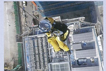
建築中高層ビルの火災現場から救出