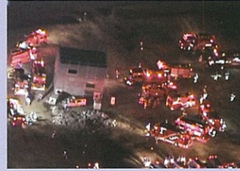
緊急消防援助隊合同訓練時の 夜間上空支援