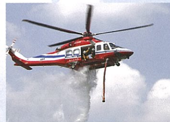
消火タンクから散水