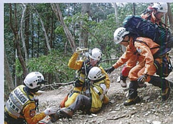
素早い応急手当とピックアップ