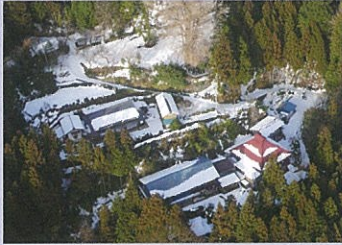
孤立地域の調査活動

震度5弱以上が発生した場合や洪水発生のおそれがある場合は防災ヘリが直ちに出勤し、上空から情報収集を行い、災害の発生状況を確認します。また、大規模な災害や状況が把握しにくい夜間の災害などでは、防災ヘリの赤外線カメラで現場の映像をリアルタイムで県庁や消防機関へ送信し、地上の活動を支援します。