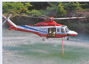
湖面から消火タンクへ吸水