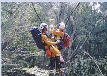
航空隊員2名が同時に降下

安全管理を行う航空隊員、降下する航空隊員、操縦士、地上の消防隊員が現場の状況や救助活動の状況を常に連絡を取り合い緊密な連携のもと、安全を確保しながら確実な救助活動を行います。活動は、山岳地域での負傷者の救出、河川や湖、ダムなどでの水難事故者の搜索・救助などのほか、高層ビルからの救出も行います。