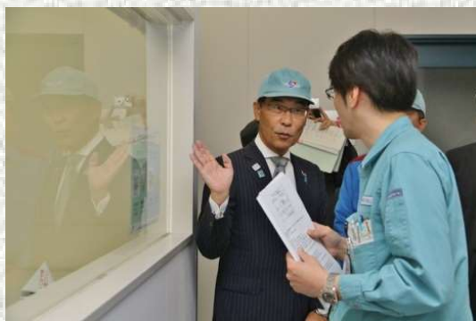
R1.10.24ふれあい訪問 ((株)高純度化学研究所:坂戸市)