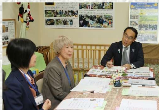
R1.10.24どこでも知事室 (ひだまり子ども食堂:川越市)