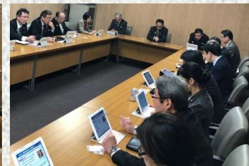
ペーパーレス会議