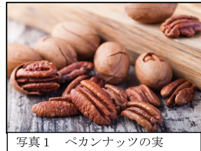
写真1 ペカンナッツの実

主な用途は、クルミと同じで、ローストして塩味をつけてスナックとして利用したり、パンやケーキに混ぜてお菓子にしたり、アイスクリームの材料にしたり、アメリカでは、伝統的なペカンパイとして食べられています。