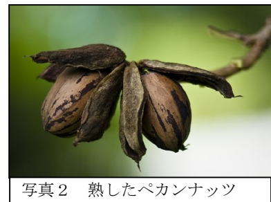
写真2 熟したペカンナッツ