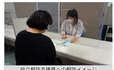
自立相談支援員への相談イメージ

長期化する新型コロナウイルス感染症の影響を踏まえ、自立相談支援員を増員し生活困窮者支援の強化を図りました。