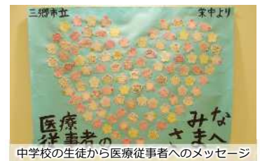
中学校の生徒から医療従事者へのメッセージ

新型コロナウイルス感染症の治療に当たる医療従事者等に対して、寄附金を活用し、応援・感謝のメッセージと県産品を贈り応援しました。