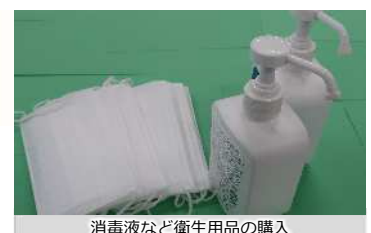
消毒液など衛生用品の購入

感染症が発生した場合においても必要な障害福祉サービスを継続して提供できるよう、人材確保や衛生用品の購入など追加で発生する経費を支援しました。