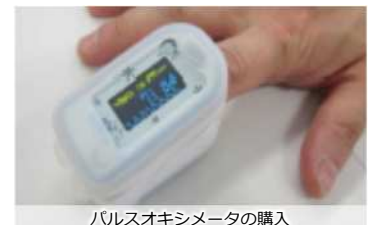
パルスオキシメータの購入

警察施設の一部改修や感染者の肺炎の早期発見に有効なパルスオキシメータの購入により、警察活動における感染拡大防止対策を実施しました。