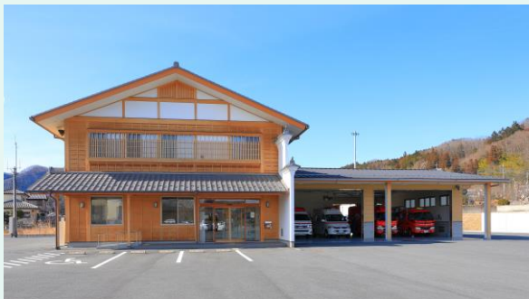
秩父消防署西分署