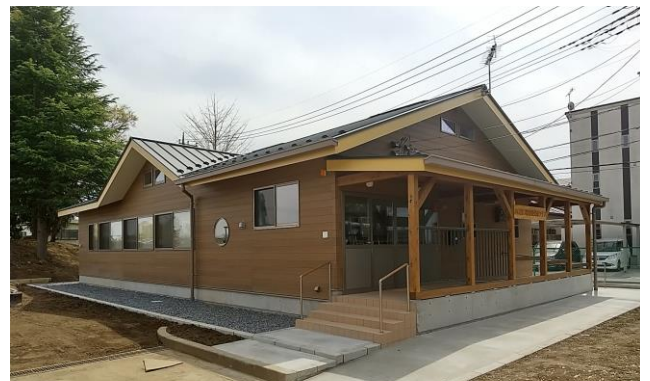
杉戸町学童クラブ／2020年度アドバイザー派遣