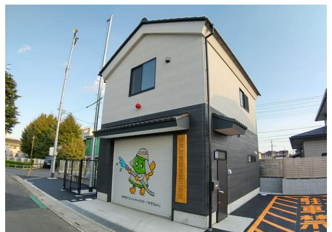
杉戸町第3消防団分団／2021年度アドバイザー派遣

木造建築技術及び木材の情報に関する専門的知識を有すると埼玉県が認めた方を、中大規模木造建築設計、原木供給、製材供給、プレカット加工等の技術区分ごとに木造建築技術アドバイザーとして登録しています。