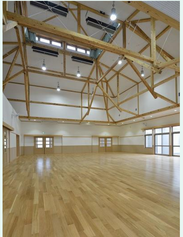
杉戸町立すぎと幼稚園・すぎと保育園