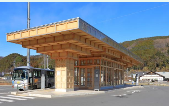
東秩父村バスターミナル