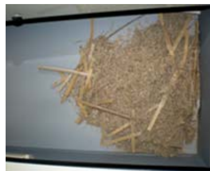
<実際に除去した紙粉>

今後、異物混入やごみ問題など市場が求める品質向上に伴い、今以上に生産現場での必要性は求められていくと思われます。