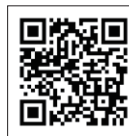
埼玉県移住就業 マッチングサイトはコチラ

埼玉県移住支援金対象求人ページに無料で求人掲載ができます。また、掲載した求人情報は民間求人まとめサイトに転載され、貴社の求人情報を求職者へ広くPRすることができます。