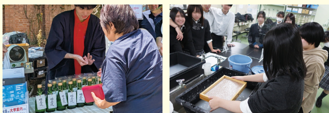
▲ユリ和紙ラベルをつけた日本酒の販売と 高校生向け和紙作り体験教室