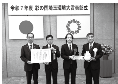
【県民部門 大賞】 埼玉工業大学 環境物質化学研究室