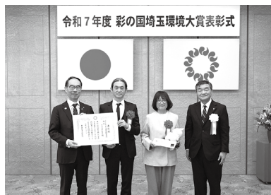
【事業者部門 大賞】 株式会社 PEC