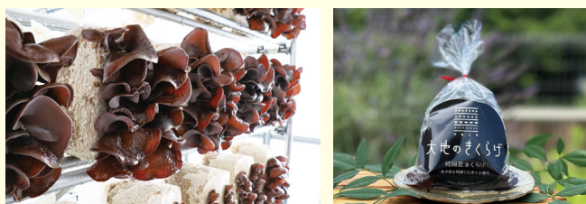
▲地中熱を活用した工場で栽培しているきくらげ (桶川市のふるさと納税の返礼品としても登録)