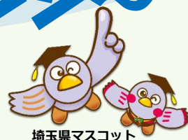
埼玉県マスコット 「コバトン」「さいたまっちゃん」