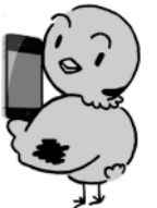
埼玉県議会マスコット 「ポッポ」